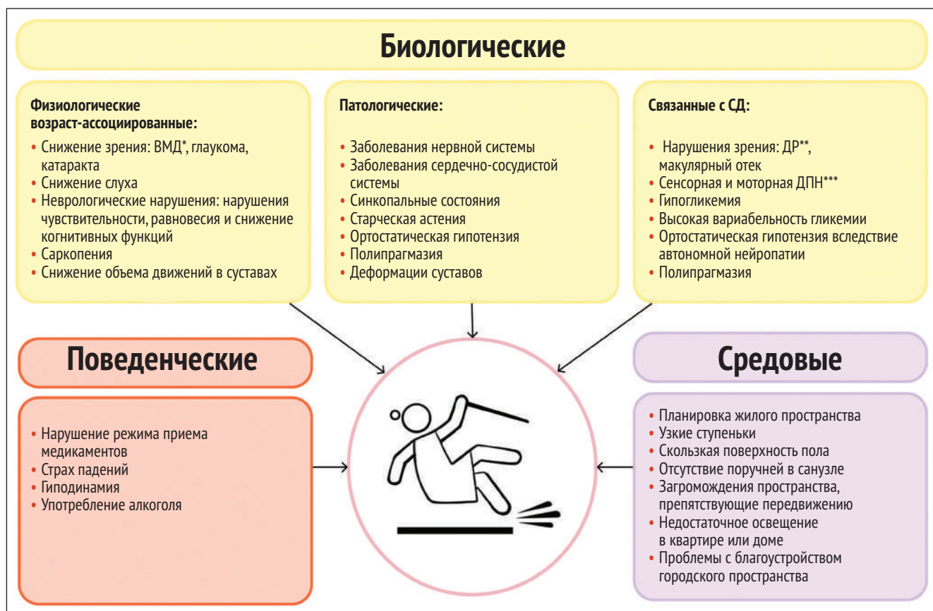
● Рисунок 1. Факторы риска падений ● Figure 1. Fall risk factors

Примечание. ВМД* – возрастная макулодистрофия, ДР** – диабетическая ретинопатия, ДПН*** – диабетическая периферическая нейропатия.